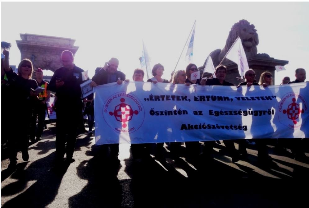
A kép a legutóbbi fővárosi tüntetésen készült május 12-én.

Tovább mélyült az árok az ápolásban, szociális ellátásban dolgozók szervezetei között az egészségügyi demonstráció óta eltelt két hétben. Az Országos Reprezentativitást Megállapító Bizottság egy évvel ezelőtt a közalkalmazotti törvény alapján elvégzett taglétszám ellenőrzés után nyilvánosságra hozta azoknak a szakszervezeteknek a listáját, amelyek országos vagy ágazati szinten a legtöbb tagdíjfizetőt tudták felmutatni. A humán- egészségügyi területen csak a Magyarországi Munkavállalók Szociális és Egészségügyi Ágazatban Dolgozók Demokratikus Szakszervezete (MSZ EDDSZ), az úgynevezett egyéb humán-egészségügyi szolgáltatásban a Mentődolgozók Önálló Szakszervezete (MÖSZ) kapott tárgyalási jogosítványokat a kormánnyal, míg a nem bentlakásos szociális ellátás területén a Bölcsődei Dolgozók Demokratikus Szakszervezete (BDDSZ) nyert el reprezentatív minősítést.